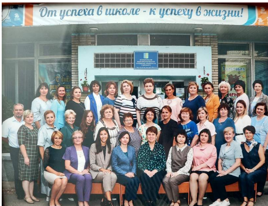
Очередной номер «Лицеиста» посвящён педагогам и не только...

Эмблемой Года педагога и наставника является пеликан. Издавна эта птица являлась символом милосердия, самопожертвования и родительской любви. Разгадка, возможно, кроется в легенде о пеликане, жертвующем собой для спасения потомства. Образ пеликана олицетворяет преемственность и глубокие традиции отечественной педагогики.